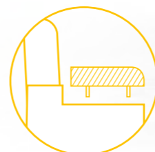
Bracciolo estraibile opzionale Removable armrest optional