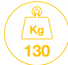
Portata Weight capacity