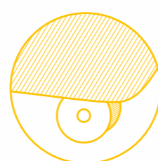
Roller di serie Standard Roller system