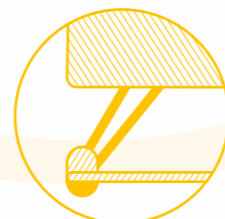
Funzione Eleva Eleva function