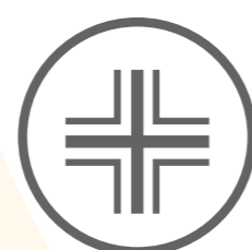
Dispositivo Medico Medical Device

Non rivestibile con tessuti: It can not be made with fabrics: 01 - 02 - 03 - 04 - 05 - 19